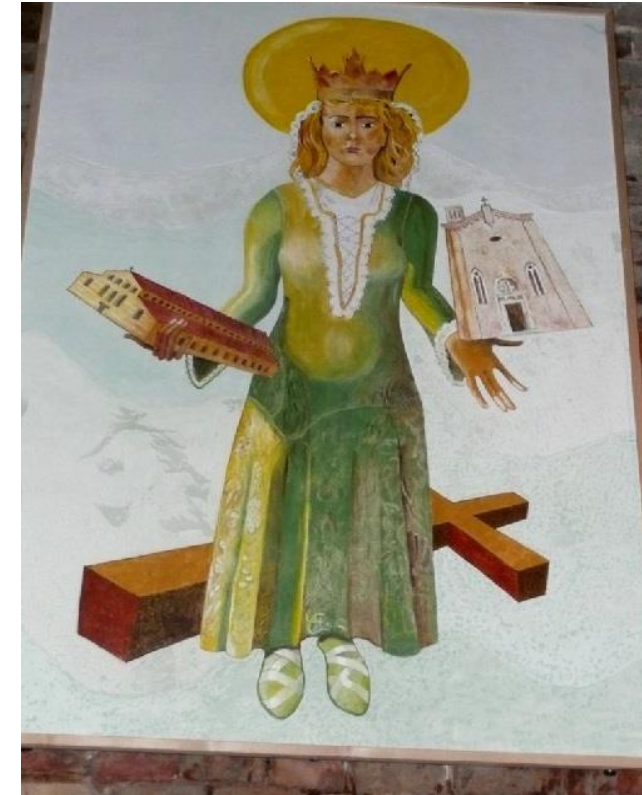
"La Santa" y "La Madre", 2 FRESCOS sobre paneles para construcción, de B. Molinas Agnellini, Iglesia de Santa Helena, Isla de Santa Helena, Venecia, 2015. (Técnica: "Buon Fresco". Sobre paneles constituídos por compensados marinos, sobre ellos paneles de viruta de madera y óxido de magnesio compactados a presión, arriccio o revoque grueso con grassello y arena de río, de 8 mm, revoques de jornada de 3 mm, pigmentos y sólo agua; total: 10 jornadas/cada fresco)