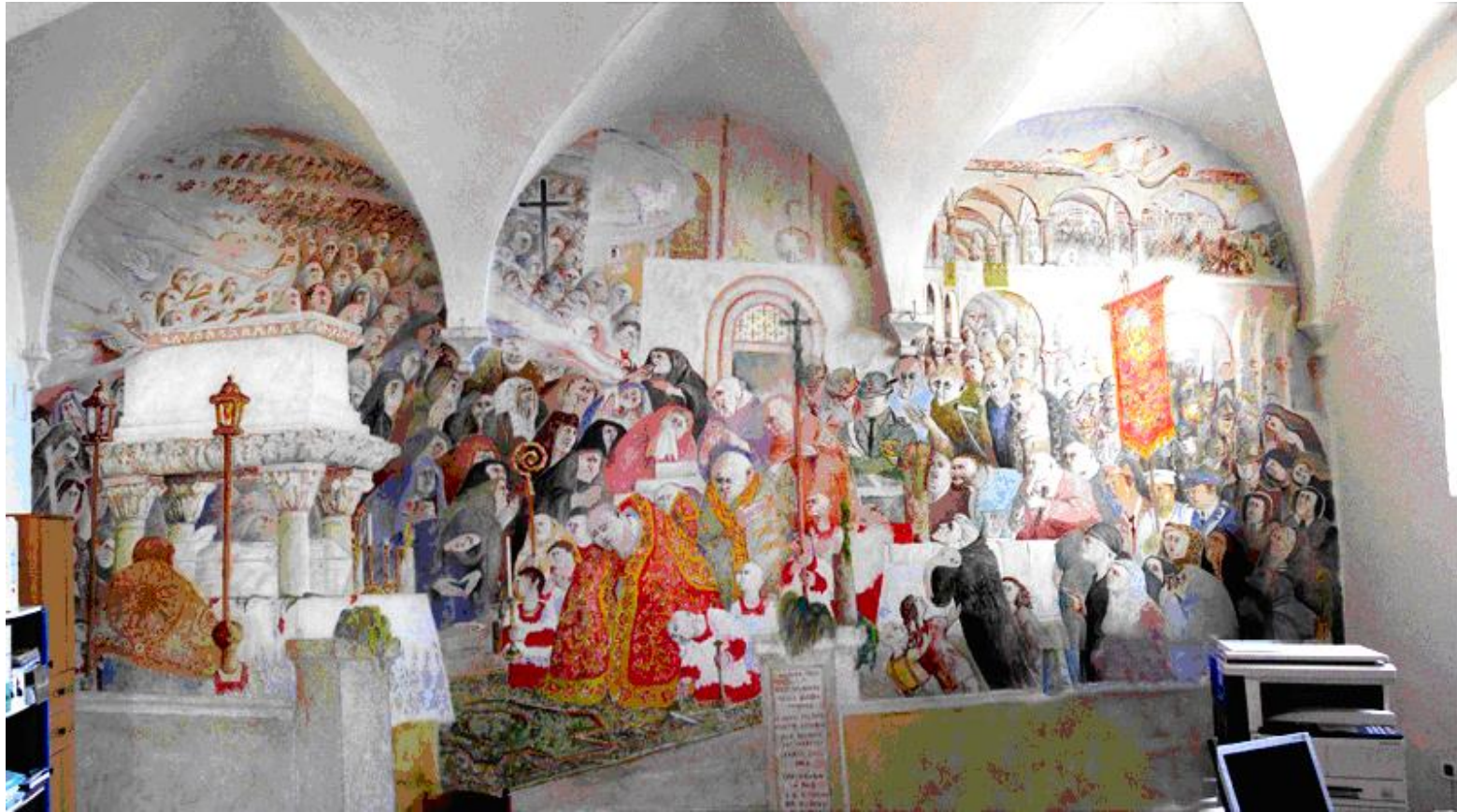
“Procesión del 1943 y reconocimiento de la reliquias”, 3.80 m x 6.50 m; Vico Calabró.

Sacristía de la Basilica Santuario de Feltre (Norte de Italia), 1975