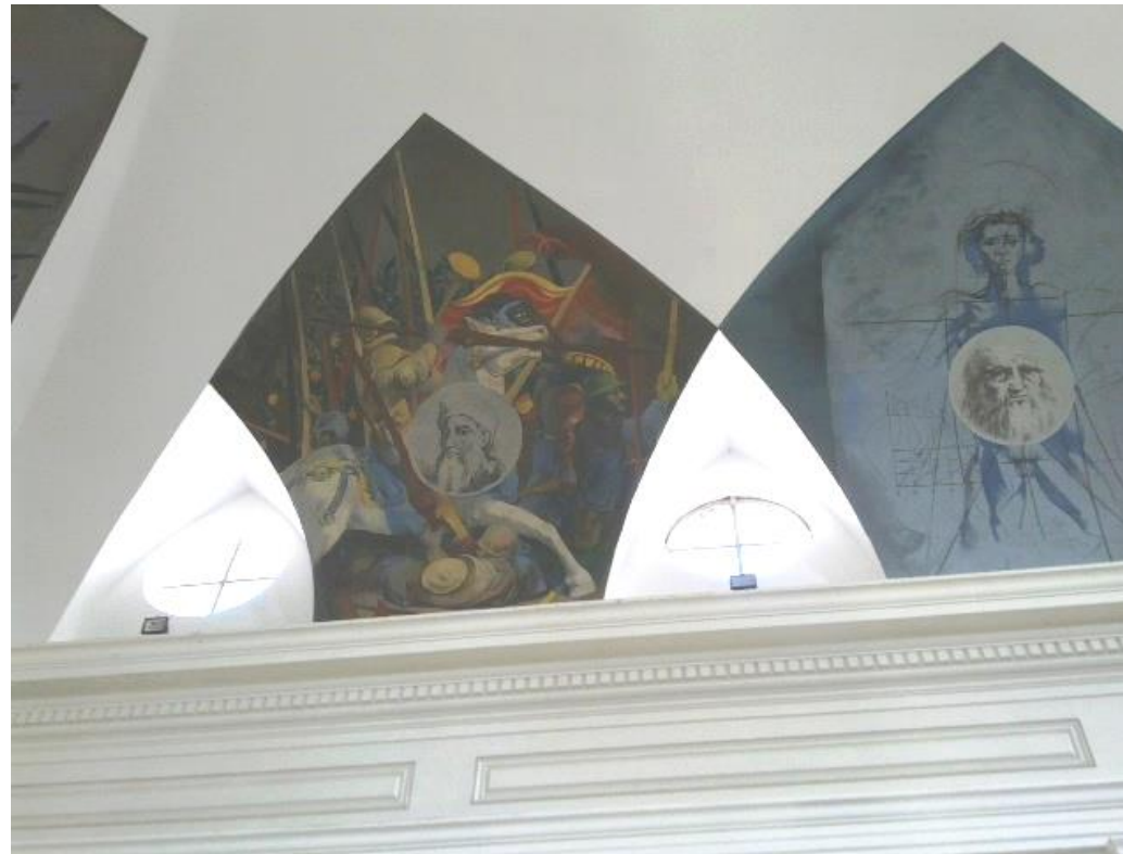
“Homenaje a las Artes”, César López Claro, Salón de actos de la Escuela de Bellas Artes Mantovani, Santa Fe, Argentina, 1985

Ejemplos (se vean las fotos): “Homenaje a las Artes”, César López Claro, cielorraso del salón de actos de la Escuela de Bellas Artes Mantovani, Santa Fe, Argentina, 1985; Numa Ayrinhac, en la parroquia de Pigué (siglo XX).