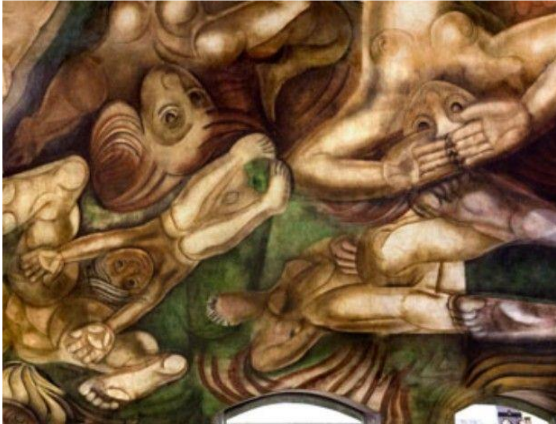
“Ejercicio plástico” de Siqueiros; 1933, actualmente en el Museo de la Casa Rosada, Buenos Aires; pigmento: piroxilina