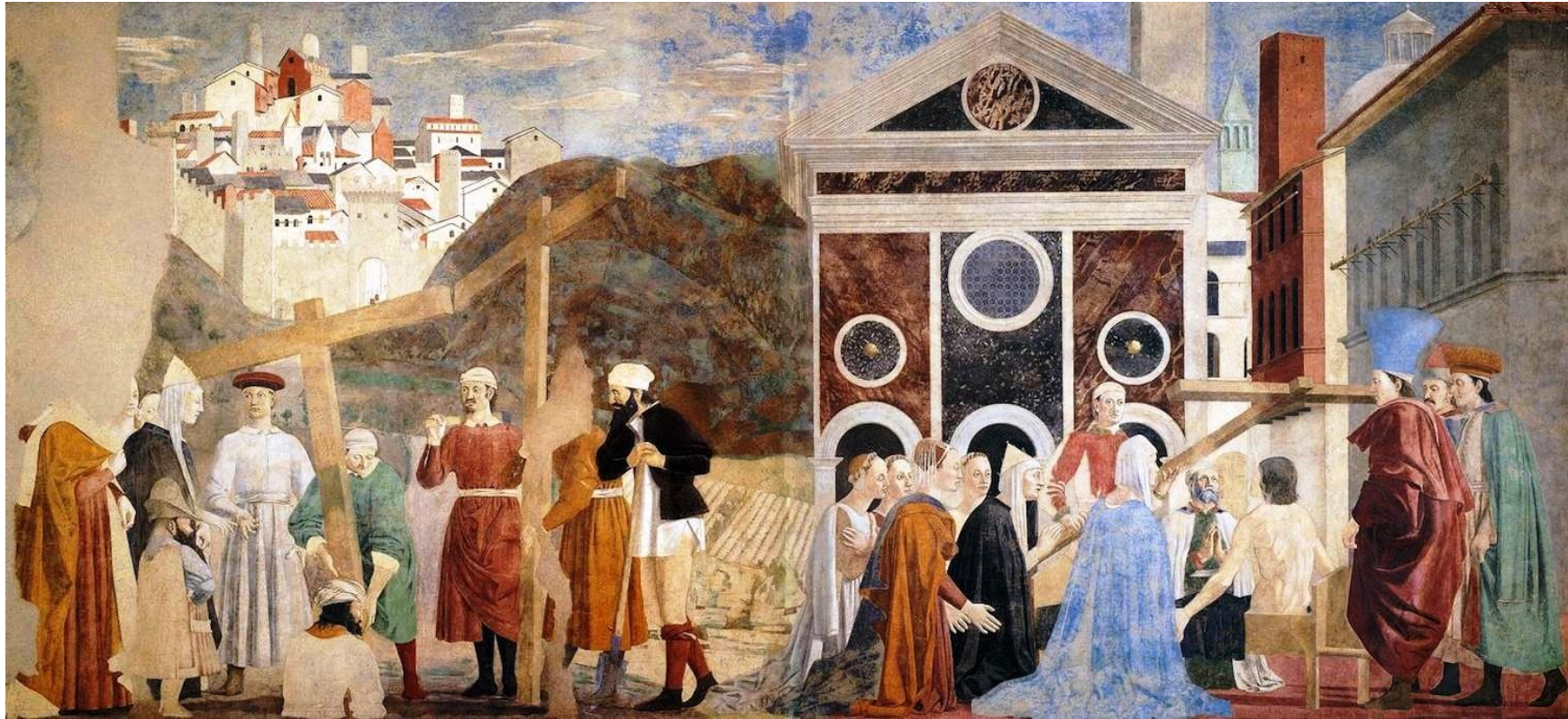
“La Leyenda de la Vera Cruz” de Piero Della Francesca, Arezzo, 1452-1466