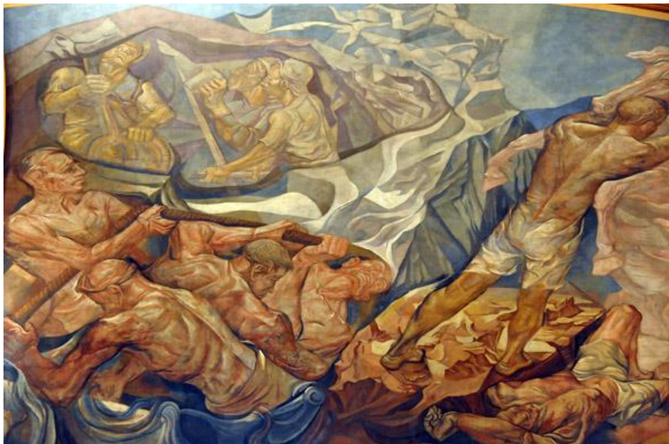
“El dominio de las fuerzas naturales” de Lino Enea Spilimbergo en la Galería Pacífico, 1946