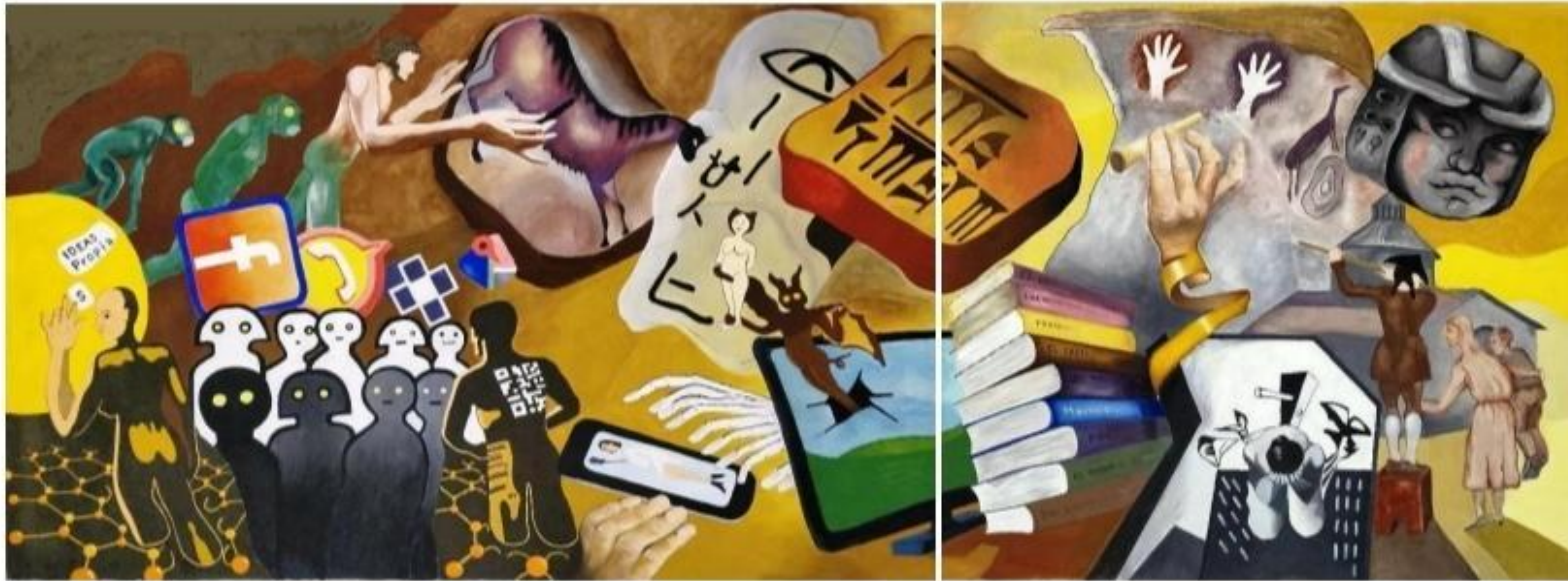
“Múltiples Lenguajes”, “Buon Fresco” sobre muro, de B. Molinas Agnellini con la Escuela EMBA de San Justo, Casa de la Cultura, S. Justo, Prov. de Santa Fe, 2018 (Técnica: “Buon Fresco”. 7 m 2 . Sobre pared, arriccio o revoque grueso con grassello y arena de río de 20 mm, revoques de cada “jornada” - grassello y arena - de 4 mm frescos, pigmentos y sólo agua; total: 10 días de 10 horas cada día, 15 “jornadas”)